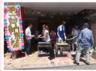
次は何食べようか 相談中です...