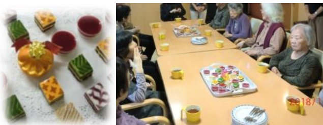
11/1 開所記念 ケーキ バイキング

ご利用者様と一緒に、10周年、20周年を迎えられますよう職員一同更なる向上に努めて参ります。