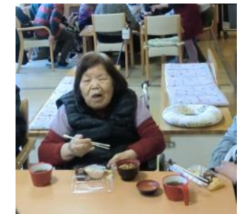
職員、ご家族様、皆でついたもち 美味しく頂きました。